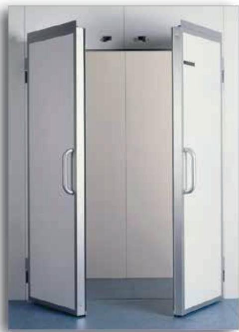
MOD. 2B/14 MOD. 2B/18